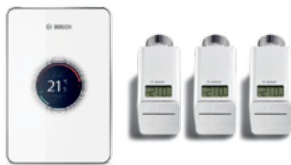
Easy control CT200

Το Set Easy Control CT200 περιλαμβάνει τον θερμοστάτη CT200 και 3 θερμοστάτες θερμαντικών σωμάτων Smart Radiator της Bosch. Οι υπάρχουσες θερμοστατικές κεφαλές θερμαντικών σωμάτων μπορούν να αντικατασταθούν απλά από τους ασύρματους θερμοστάτες Smart Radiator της Bosch για τα θερμαντικά σώματα. Αυτοί μπορούν εύκολα να τοποθετηθούν και μετά την ολοκλήρωση της εγκατάστασης, μπορείτε να ρυθμίσετε ένα ατομικό χρονοπρόγραμμα για κάθε θερμοστάτη Smart Radiator μέσω της εφαρμογής (app) EasyControl. Αυτό θα εξασφαλίσει, ότι τα θερμαντικά σώματα στα δωμάτια του σπιτιού σας θερμαίνονται μόνο, όταν είναι απαραίτητο και στη θερμοκρασία που θέλετε. Αυτό θα βελτιώσει την εξοικονόμηση ενέργειας ενώ θα αυξήσει το επίπεδο άνεσης σας κατακόρυφα.