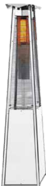
Σε inox χρώμα

Οι θερμάστρες εξωτερικού χώρου Kaliente συνδυάζουν την κομψότητα με την λειτουργικότητα. Η ζωντανή ορατή τους φλόγα δημιουργεί μια αισθησιακή ατμόσφαιρα και θαλπωρή σε κάθε εξωτερικό χώρο. Με την λειτουργία Start up χειροκίνητου ή μέσω ηλεκτρονικού τηλεχειριστηρίου και με 3 επίπεδα θέρμανσης γίνεται ακόμη πιο "προκλητική" η επιλογή τους... Λειτουργία με: υγραέριο - (LPG) και φυσικό αέριο. Κάθε θερμάστρα μπορεί να καλύψει μια περιοχή έως 20 τ.μ. Είναι κινητή και μπορεί να τοποθετηθεί εύκολα οπουδήποτε απαιτείται.