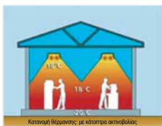
Κατανομή θέρμανσης: με κάτοπτρα ακτινοβολίας