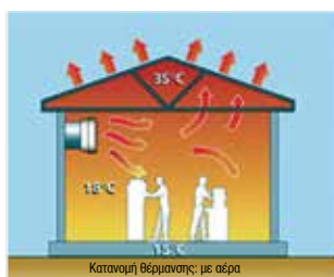
Κατανομή θέρμανσης: με αέρα